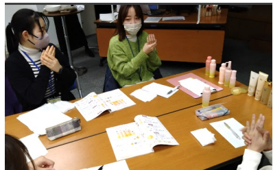
実際に化粧品を試しながら説明を聞く様子