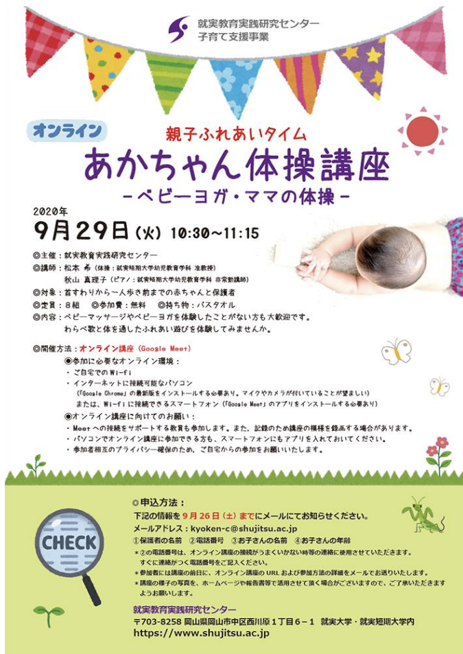
『親子ふれあいタイム』第2回チラシ