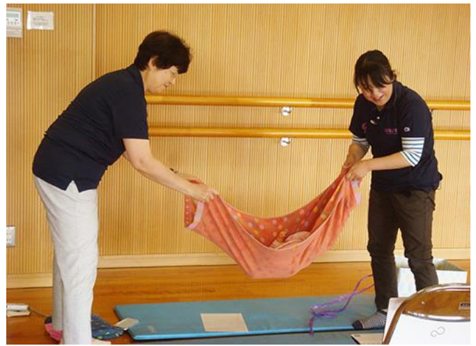
バスタオルを使って、ゆらゆら～