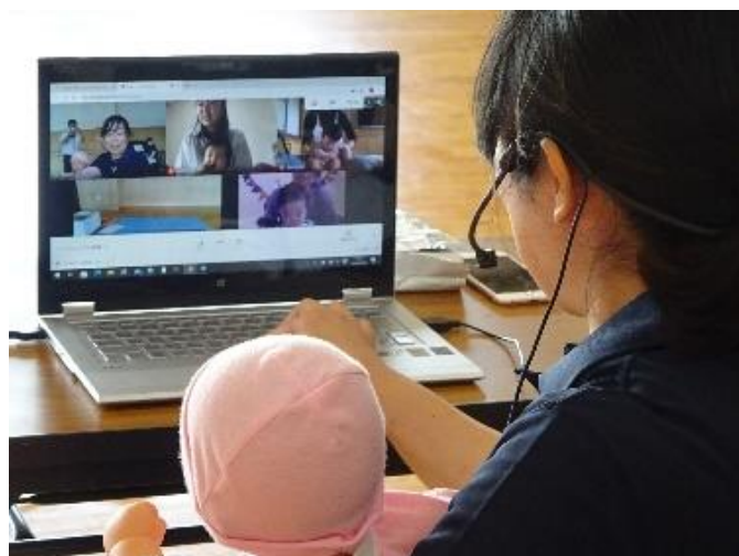
オンラインで参加してくださった皆様