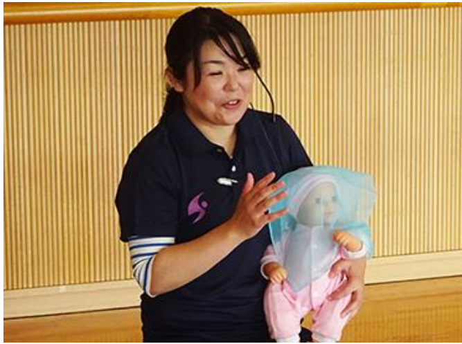
いない いない ばあ～！