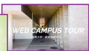
キャンパスツアー